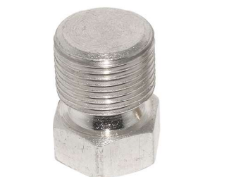
Parafuso torquimétrico com ponta giratória de aço inox.